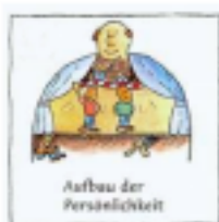
Aufbau der Persönlichkeit